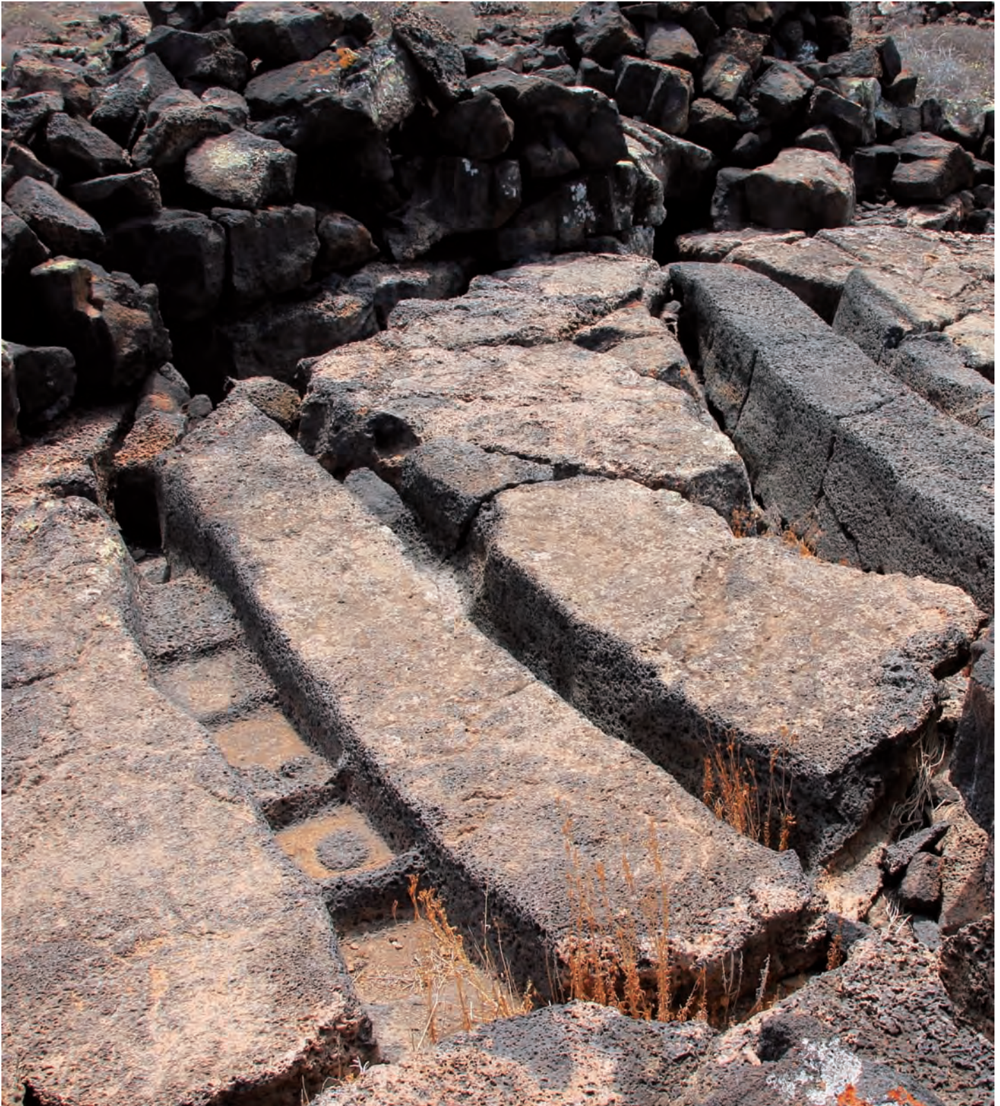
Quesera de Bravo

Los restos artesanales con menor presencia son los útiles óseos , casi siempre huesos alargados (de origen caprino, ovino y porcino). Estos huesos se pulían para hacer los objetos cortantes y punzantes.